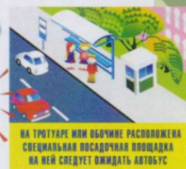
НА ТРОТУАРЕ ИЛИ ОБОЧИНЕ РАСПОЛОЖЕНА СПЕЦИАЛЬНАЯ ПОСАДОЧНАЯ ПЛОЩАДКА НА НЕЙ СЛЕДУЕТ ОЖИДАТЬ АВТОБУС