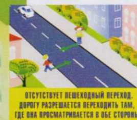
ОТСУТСТВУЕТ ПЕШЕХОДНЫЙ ПЕРЕХОД, ДОРОГУ РАЗРЕШАЕТСЯ ПЕРЕХОДИТЬ ТАМ, ГДЕ ОНА ПРОСМАТРИВАЕТСЯ В ОБЕ СТОРОНЫ

Чтобы возле перекрёстка Ты дорогу перешёл, Все цвета у светофора Нужно помнить хорошо! Загорелся красный свет — Пешеходам хода нет! Жёлтый — значит подожди, А зелёный свет — иди!