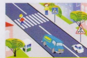
НАЗЕМНЫЙ ПЕШЕХОДНЫЙ ПЕРЕХОД ОБОЗНАЧАЕТСЯ СПЕЦИАЛЬНЫМИ ДОРОЖНЫМИ ЗНАКАМИ И РАЗМЕТКОЙ

Вот обычный переход. По нему идёт народ. Здесь специальная разметка, «Зеброю» зовётся метко! Белые полосы тут Через улицу ведут! Знак «Пешеходный переход» Где на «зебре» пешеход, Ты на улице найди И под ним переходи!