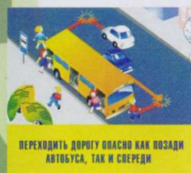
ПЕРЕХОДИТЬ ДОРОГУ ОПАСНО КАК ПОЗАДИ АВТОБУСА, ТАК И СПЕРЕДИ