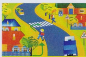
ПО ОБОЧИНЕ ДОРОГИ СЛЕДУЕТ ИДТИ НАВСТРЕЧУ ДВИЖЕНИЮ ТРАНСПОРТА