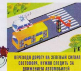
ПЕРЕХОДИ ДОРОГУ НА ЗЕЛЁНЫЙ СИГНАЛ СВЕТОФОРА, НУЖНО СЛЕДИТЬ ЗА ДВИЖЕНИЕМ АВТОМОБИЛЕЙ